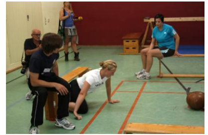
Die Presse verfolgt alles ganz genau

Informationen werden demnächst für alle Berufsfeuerwehren über den Deutschen Städtetag verteilt. Auf unserer Homepage www.feuerwehrfrauen.de können die Informationen in den nächsten Tagen auch heruntergeladen werden.