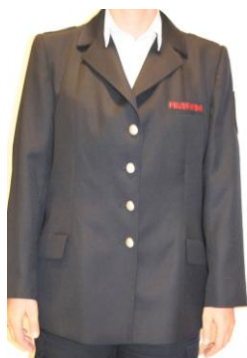
Eine geänderte Herrenjacke - Passend?