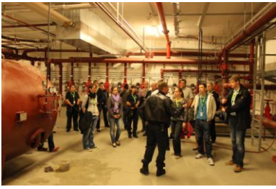
Besichtigung des Flughafens