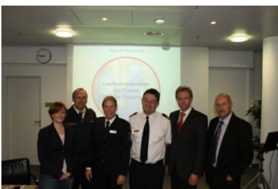
Die Referenten und Organisatoren